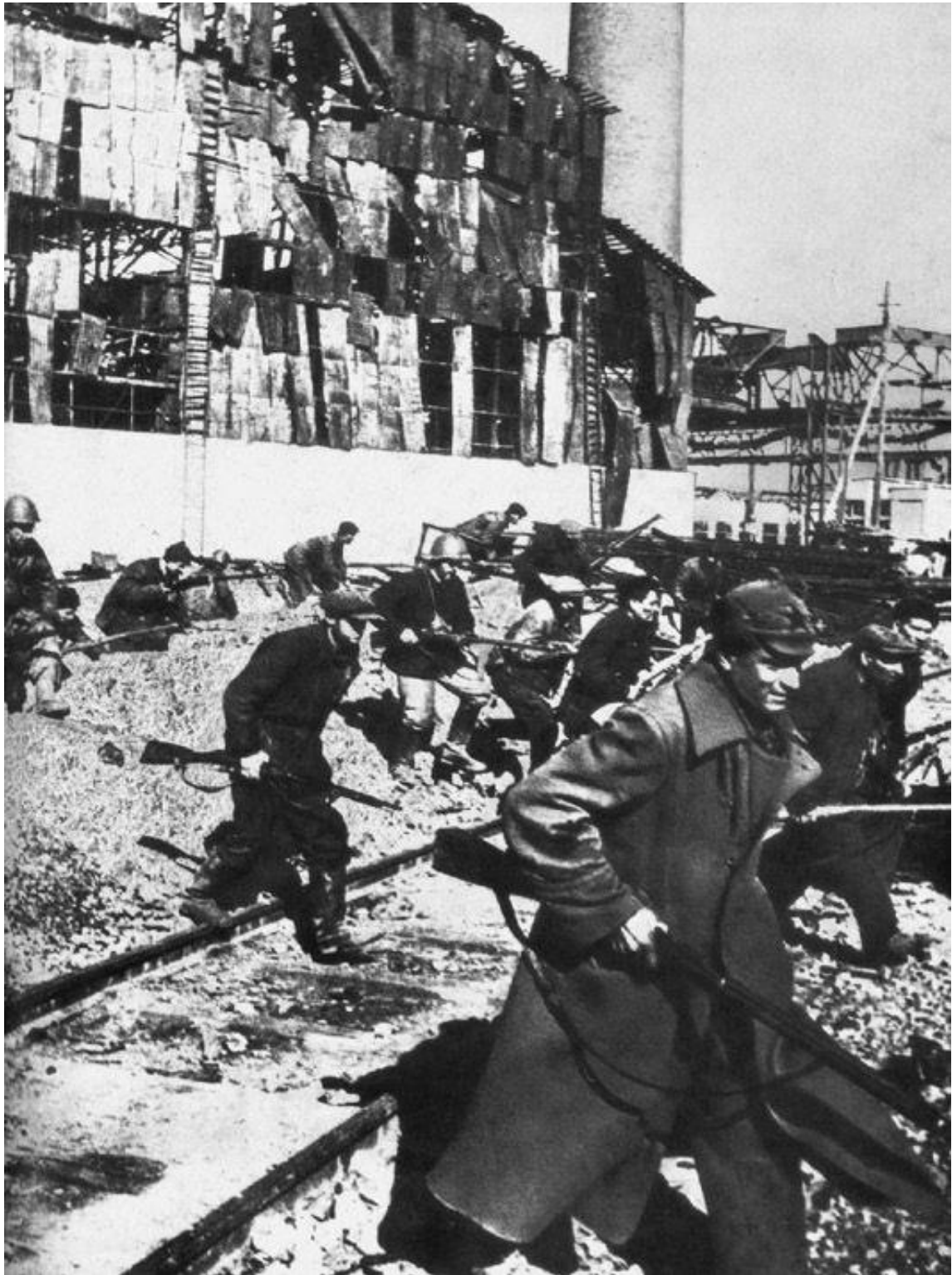
5. Voluntarios civiles: obreros de la fábrica de tractores se movilizan para combatir a los nazis.