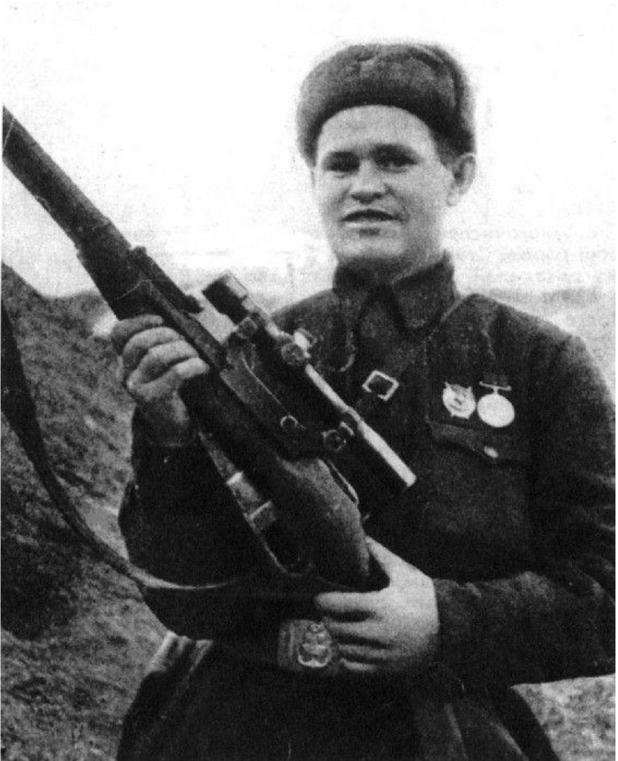
1. Vasili Záitsev, Stalingrado, octubre de 1942