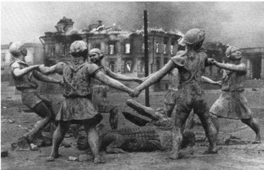
4. (Arriba) Vasili Záitsev y otros tres francotiradores de su grupo, entre ellos Galifan Abzálov. (Abajo) La escultura de los niños jugando en corro se halla cerca del centro de Stalingrado. La foto fue tomada en el apogeo de la batalla.