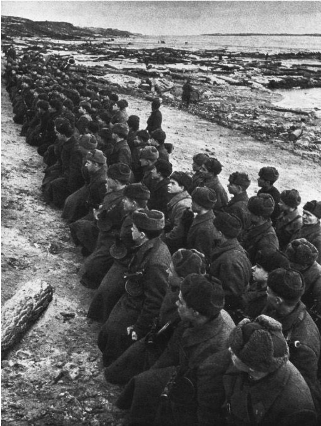
6. Los fusileros del Ejército Rojo se disponen a cruzar el Volga. El cargador de tambor de la PPSH-41 soviética tenía capacidad para 71 balas.